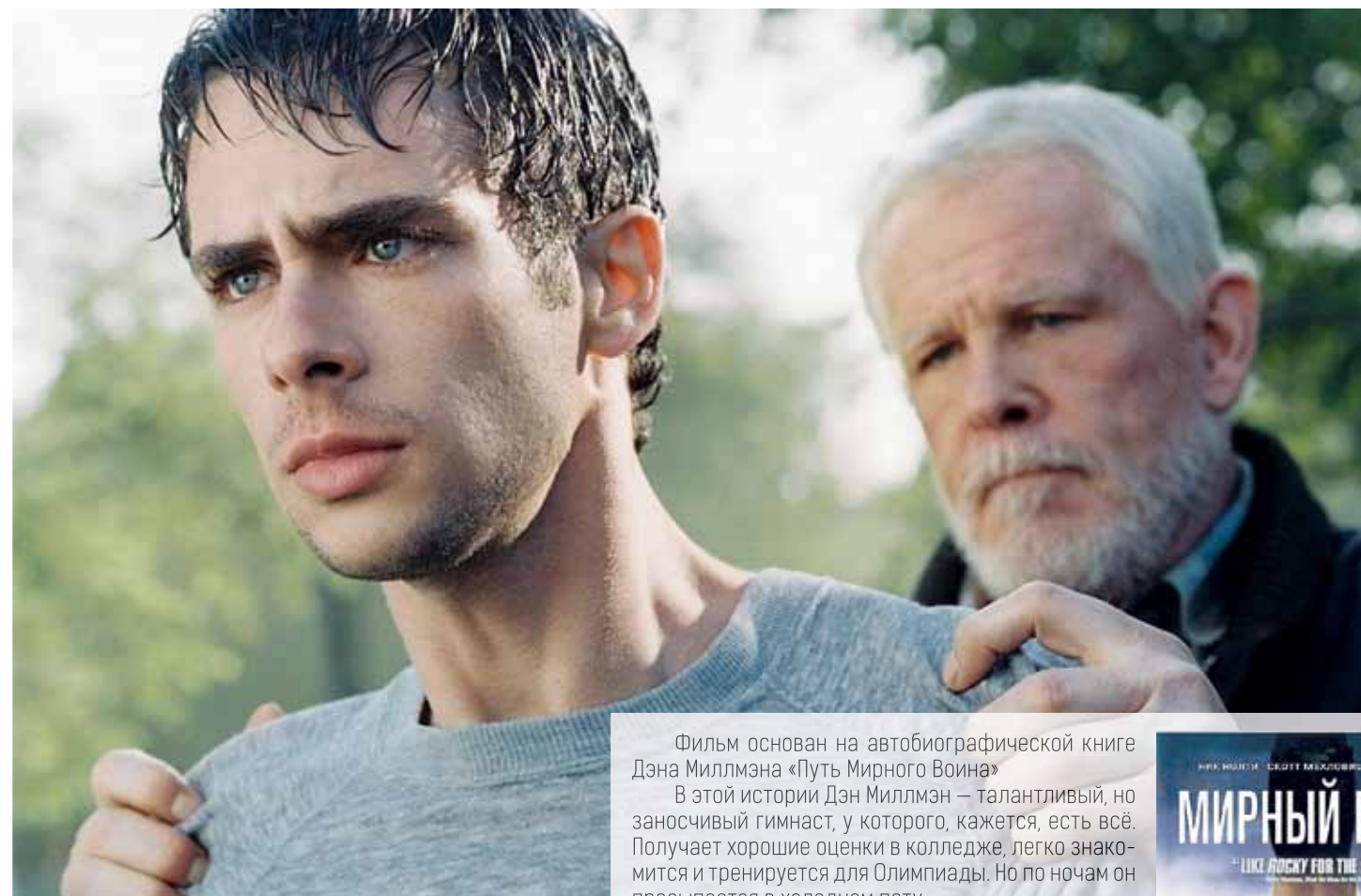
Фильм основан на автобиографической книге Дэна Миллмана «Путь Мирного Воина»

В 2006 году вышел фильм под названием «Мирный воин». В нем – глубокая мудрость, полностью соответствующая православному мировоззрению. Главный посыл фильма идентичен словам из Евангелия от Матфея: «Итак не заботьтесь о завтрашнем дне, ибо завтрашний [сам] будет заботиться о своем: довольно для [каждого] дня своей заботы» (Мф.6,34). Фильм настолько наполнен мудрыми цитатами и диалогами, что хочется просто выложить их в статье, так как ни добавить к ним, ни отнять нечего.