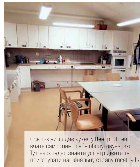
Ось так виглядає кухня у Центрі. Дітей вчать самостійно себе обслуговувати Тут нескладно знайти усі інгредієнти та приготувати національну страву meatballs