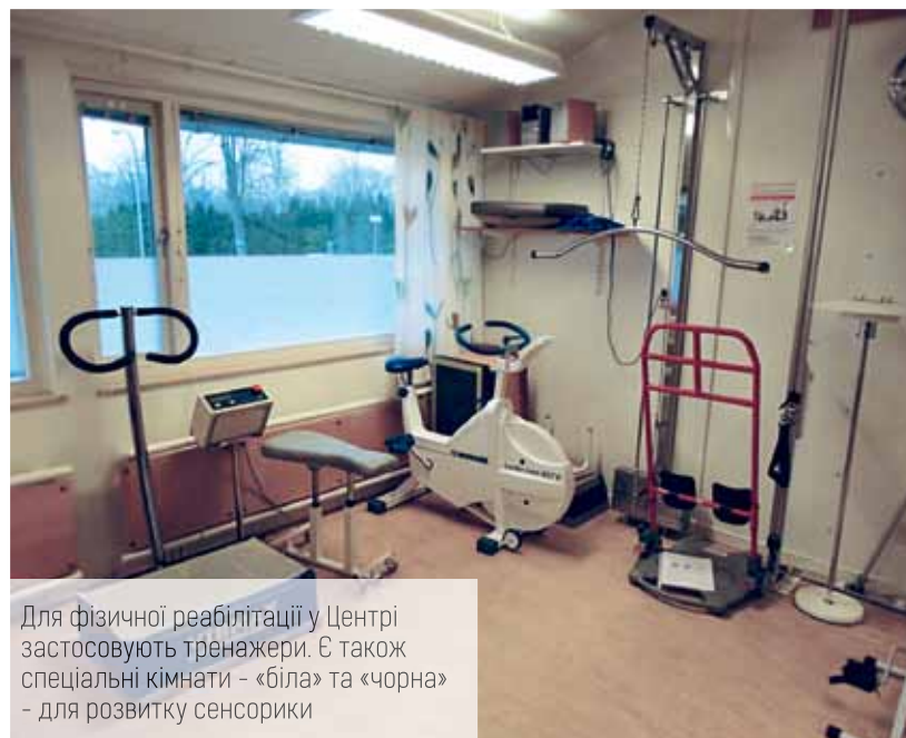
Для фізичної реабілітації у Центрі застосовують тренажери. Є також спеціальні кімнати - «біла» та «чорна» - для розвитку сенсорики

На третьому етапі спільно з батьками, а також за бажанням дитини, спільно з дитиною, складається конкретний план абілітації/реабілітації: визначаються цілі, дії та послідовність заходів. Етап займає від кількох тижнів до півроку, вводиться послідовно і корегується залежно від моніторингу ефективності.