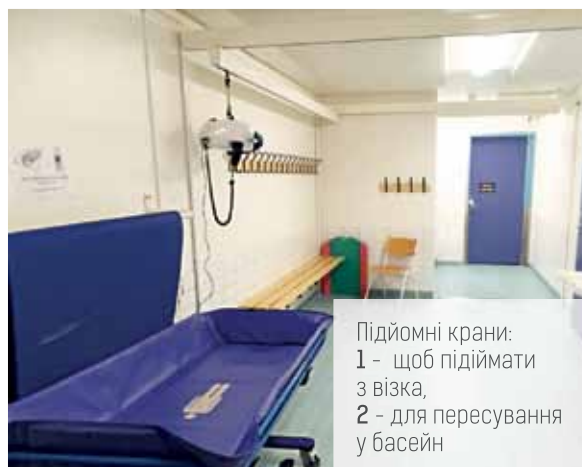
Підйомні крани: 1 - щоб підіймати з візка, 2 - для пересування у басейн

На останньому етапі здійснюється моніторинг результатів, наскільки результат відповідає цілі, і далі все відбувається по колу – знову в тісній співпраці з батьками ставиться нова ціль, план досягнення тощо.