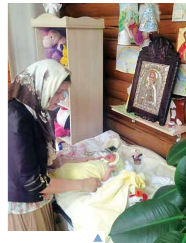
▲ Наші найменші парафіяни! Ось навіщо пеленальний столик у храмі!