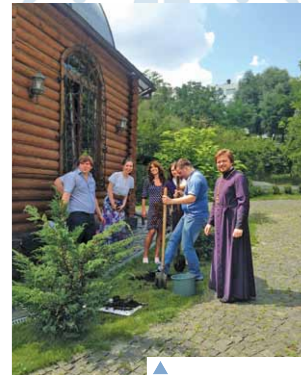
▲ Сімейних дерев біля нашого храму стає все більше!