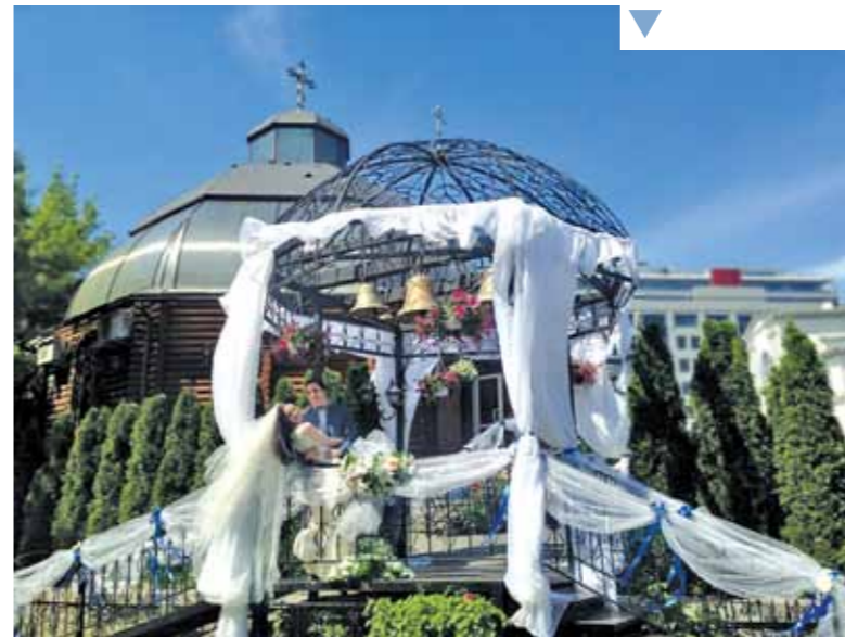
▼ Вінчання під Куполом! Многая літа молодим!