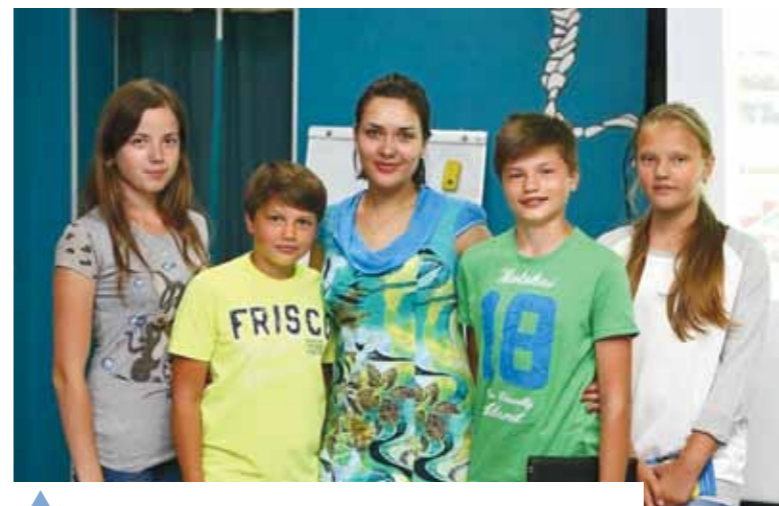
▲ Вихованці дитячого клубу «Недільна школа» відвідали майстер-клас українки, яка вступила до 17 європейських вишів