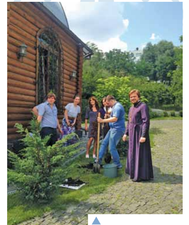
▲ Сімейних дерев біля нашого храму стає все більше!