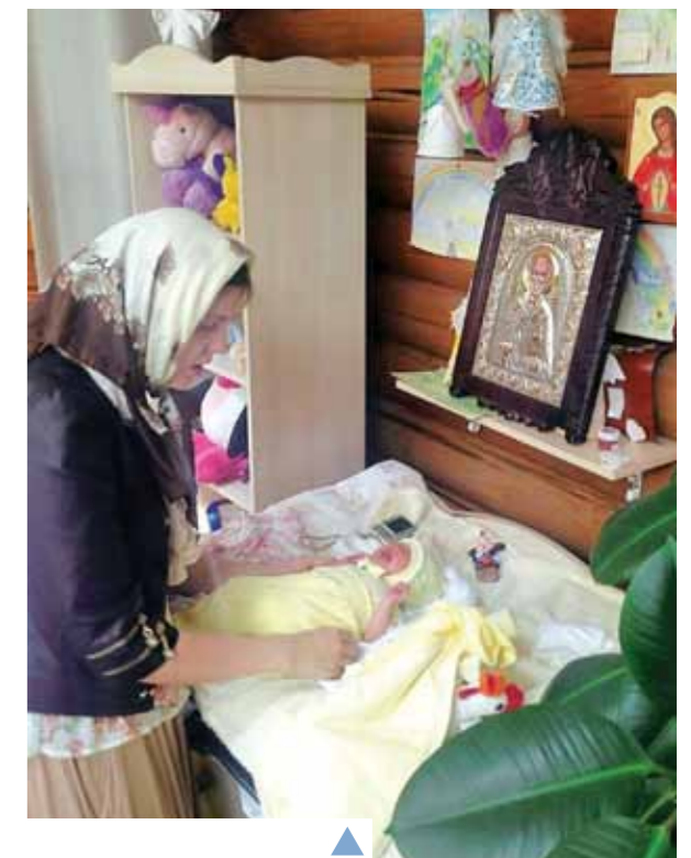
▲ Наші найменші парафіяни! Ось навіщо пеленальний столик у храмі!