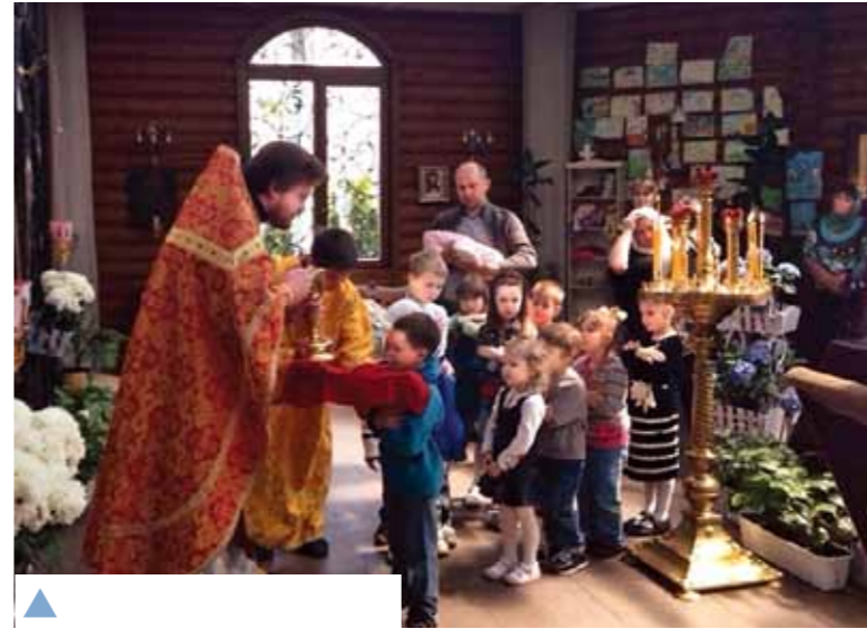
▲ В очікуванні Причастя. У храмі 20 дорослих і 40 дітей!