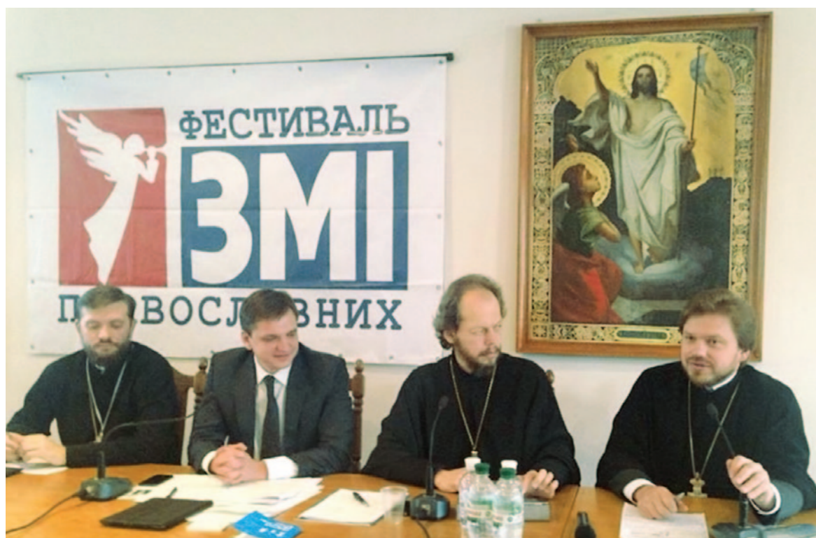
▲ VIII Фестиваль православних ЗМІ

Активна робота дитячого клубу «Недільна школа». Регулярно проводяться святкові заходи для дітей – дні народження членів дитячого клубу разом із батьками, релігійні свята, конкурси виробів та малюнків, майстер-класи.