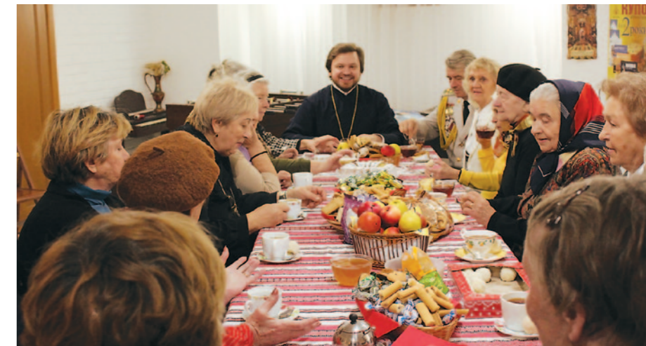
▲ Ветеранський клуб «Зв'язок поколінь»