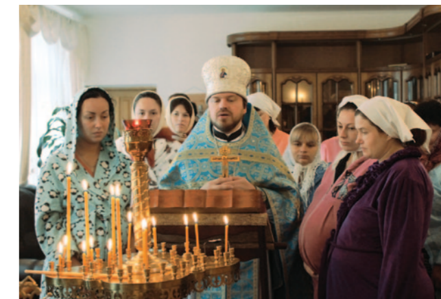
▲ Храм на честь ікони Пресвятої Богородиці «Помічниця в пологах» при Київському міському пологовому будинку №1