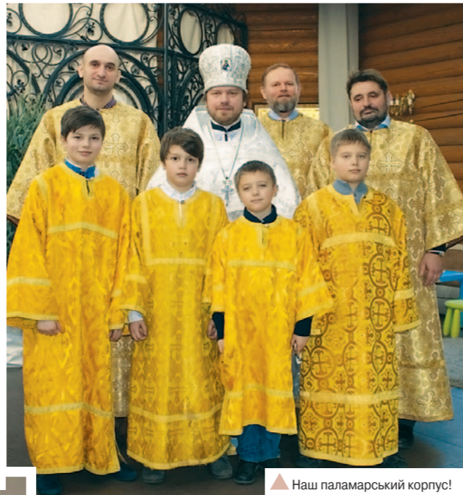
Наш паламарський корпус!