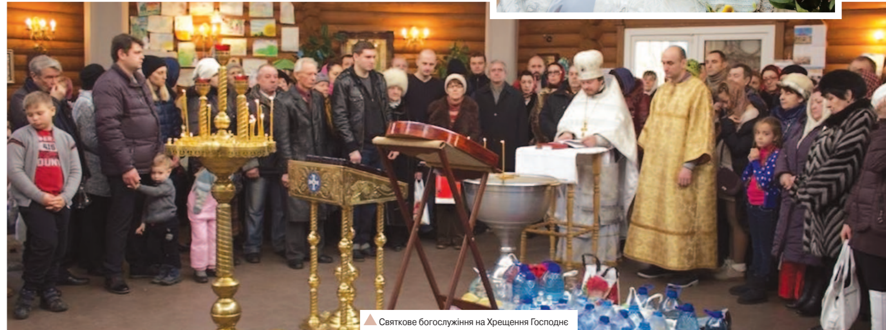
Святкове богослужіння на Хрещення Господнє