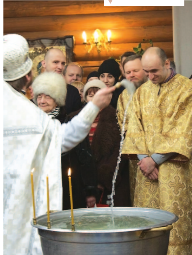
На Різдвяному богослужінні!