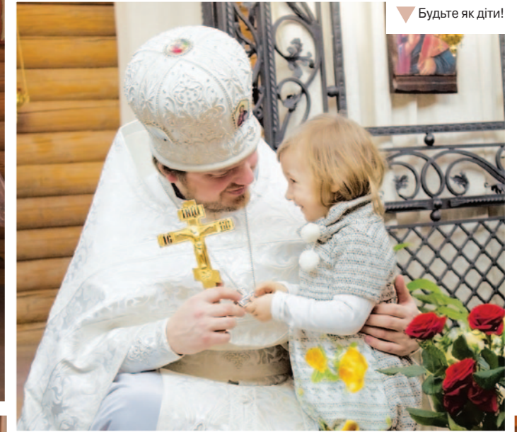
Будьте як діти!