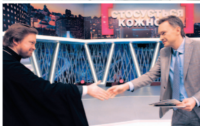
▲ Участь у ток-шоу «Стосується кожного» на телеканалі «Інтер»