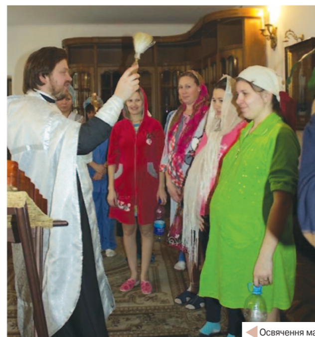
Освячення майбутнього України!