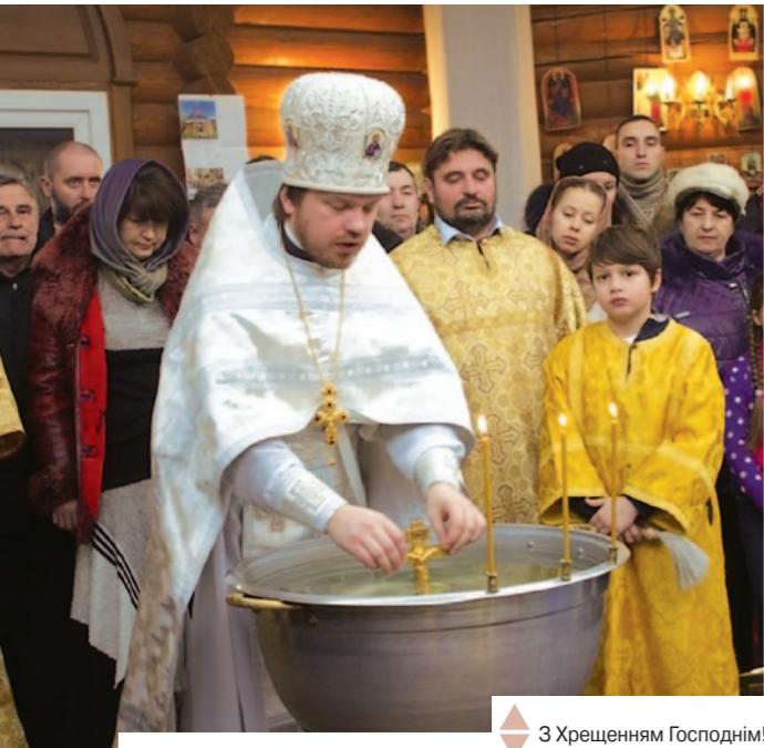
З Хрещенням Господнім!