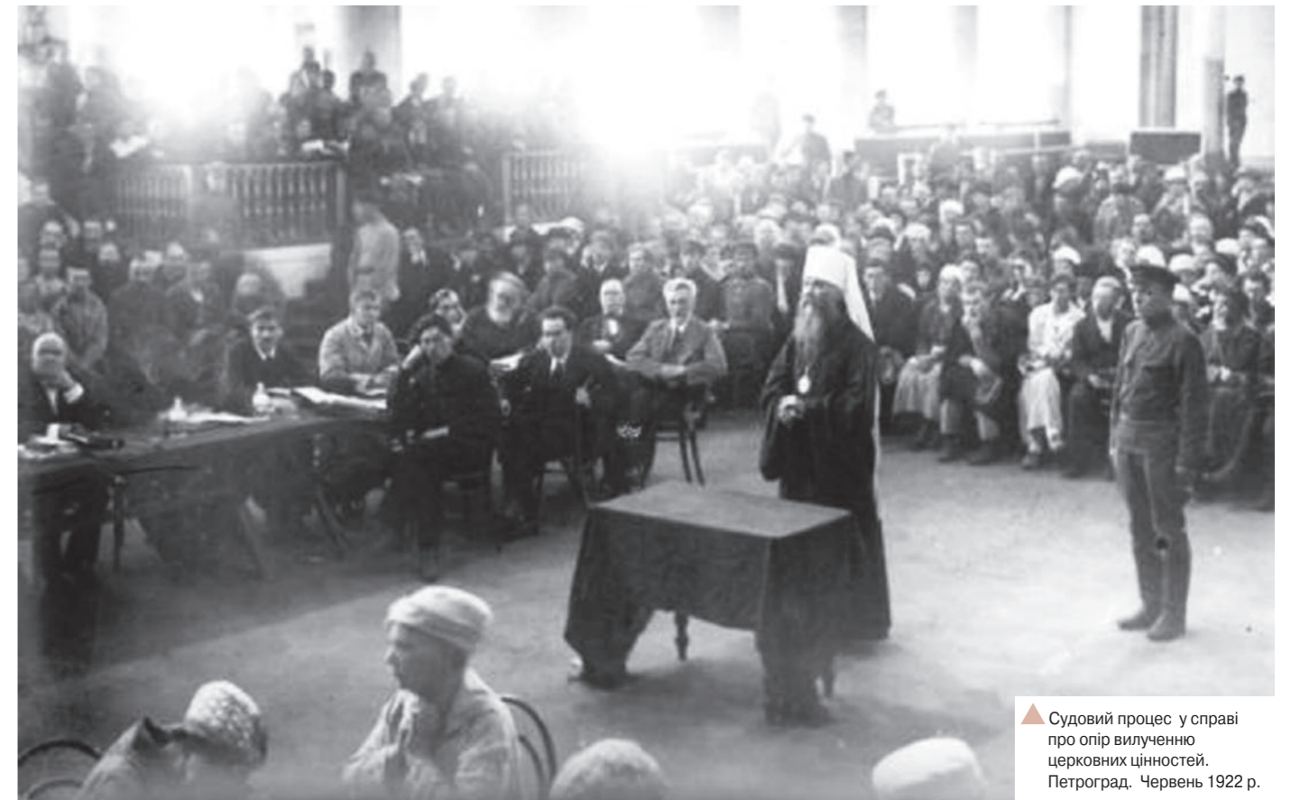
▲ Судовий процес у справі про опір вилученню церковних цінностей. Петроград. Червень 1922 р.