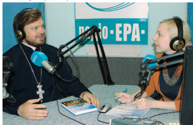
▲ Виступ на радіо «Ера»

Функціонування Клубу православної дискусії (КПД). Гості Клубу у формі діалогу обговорюють сучасні виклики в Православ'ї.