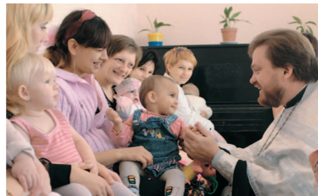
▲ Соціальний центр Київської області в місті Фастові