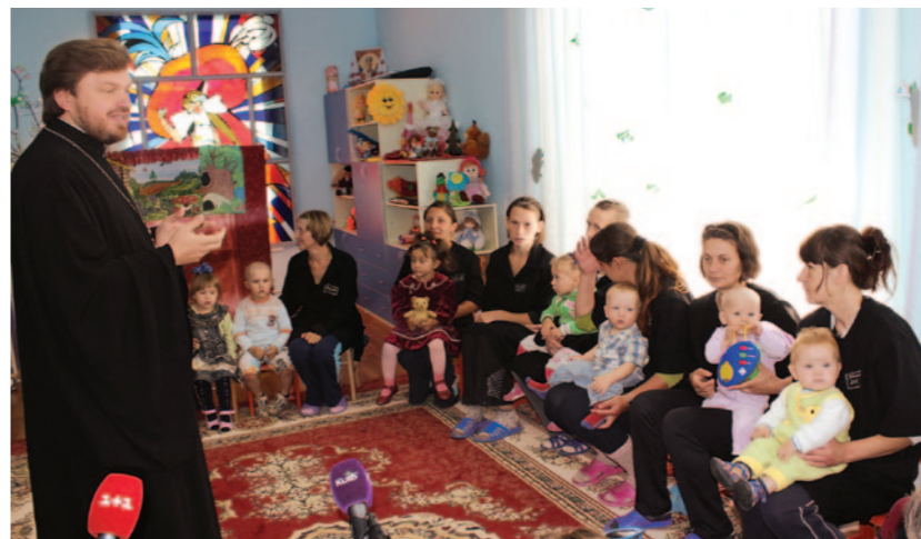
▲ Чернігівська виправна колонія