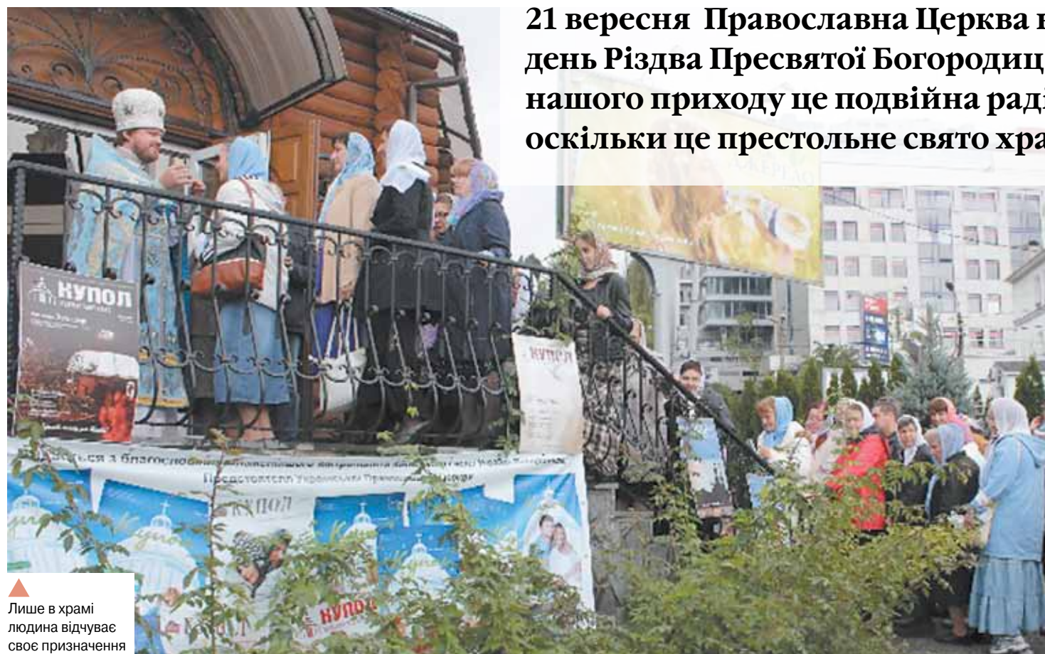
Лише в храмі людина відчуває своє призначення

21 вересня Православна Церква відзначає день Різдва Пресвятої Богородиці. А для нашого приходу це подвійна радість, оскільки це престольне свято храму.