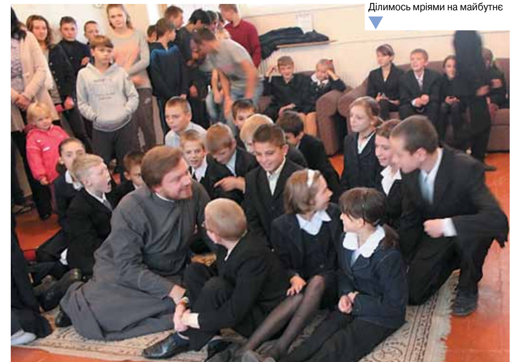
Ділимося мріями на майбутнє

Прес-служба епархіального відділу у справах сім'ї Київської епархії