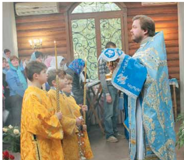
Послух паламаря – дуже відповідальний та почесний