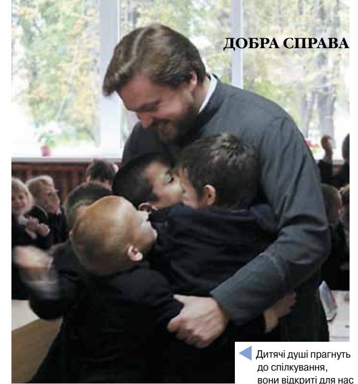
Дитячі душі прагнуть до спілкування, вони відкриті для нас