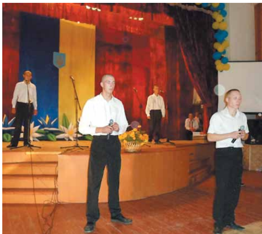
Юні таланти Прилуцької колонії

2 вересня настоятель храму на честь Різдва Пресвятої Богородиці протоієрей Олег Мельничук відвідав Прилуцьку виховну колонію, де пройшла урочиста лінійка з нагоди святкування Дня знань.