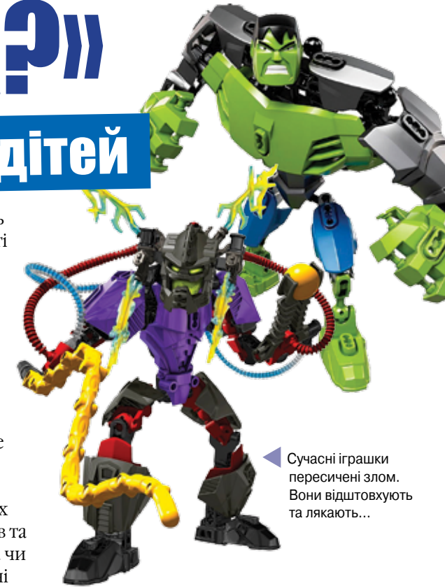
Сучасні іграшки пересичені злом. Вони відштовхують та лякають...

Здавня ляльки були синонімом дитячої невинності. Сучасні ж ляльки подекуди повна протилежність невинності. З цього найбільший шок у мене, як людини з педагогічною освітою, викликають іграшки у стилі жахів. Це серія ляльок Монстер Хай для підлітків. Тільки-но вслухайтеся в їх імена: дочка снігової людини, дочка зомбі, дочка Франкенштейна, дочка морського монстра, дочка графа Дракули, дочка перевертня, дочка мумії, син містера і місіс Хайд і т.д. У цій серії є також текстильні ляльки з очима-гудзиками, схожі на вампірів та зомбі. виправдовувати їх існування тим, що «дітям це подо-