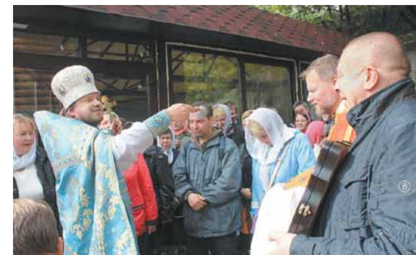
Кропіння святою водою – хвилини щастя для душі