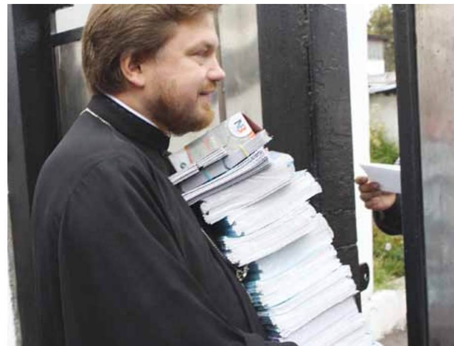
Шкільне приладдя для учнів колонії

Прес-служба епархіального відділу у справах сім'ї Київської епархії