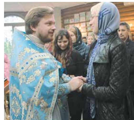
Спілкування із прихожанами: кожен свій, кожному є що сказати