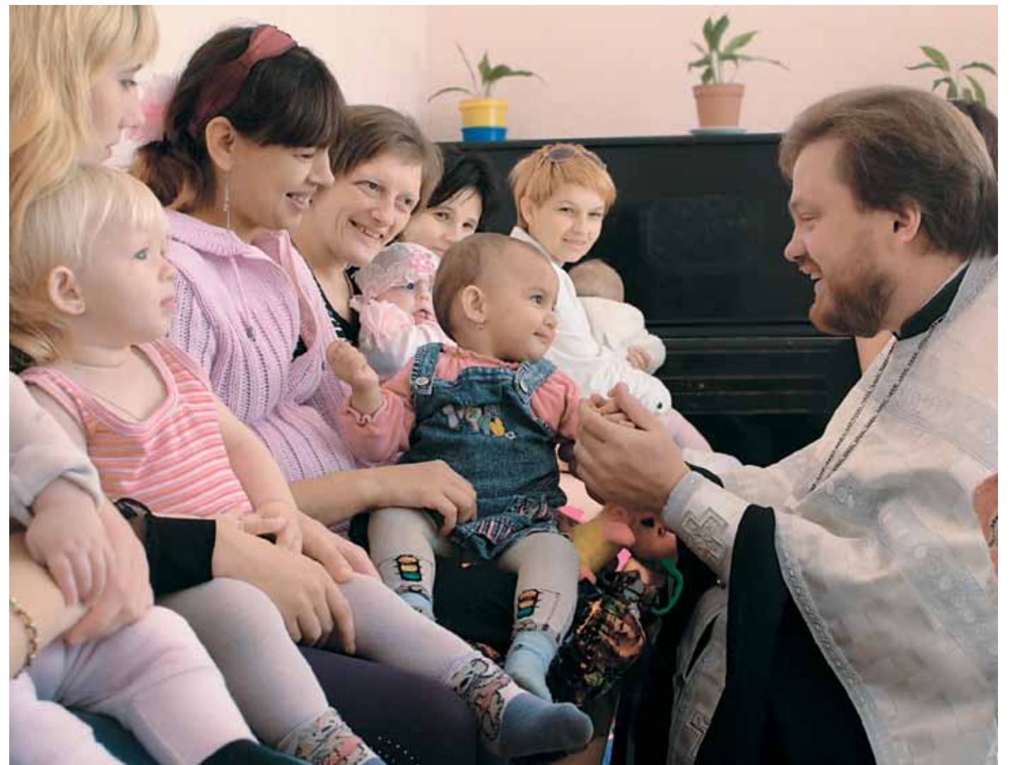
▼ Духовна бесіда із мамами та дітьми