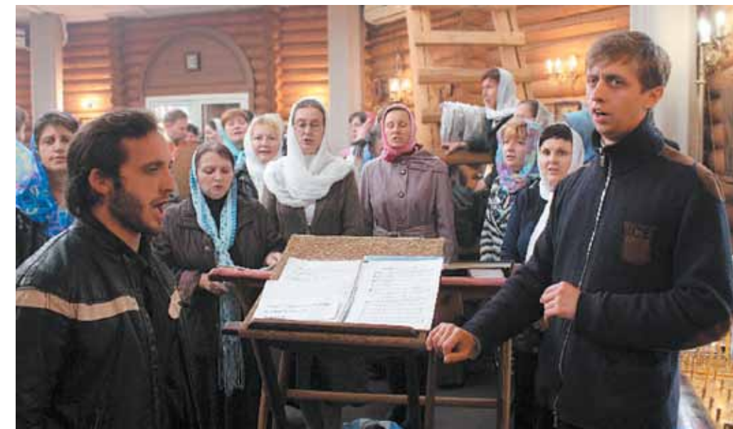
Хресний хід навколо храму