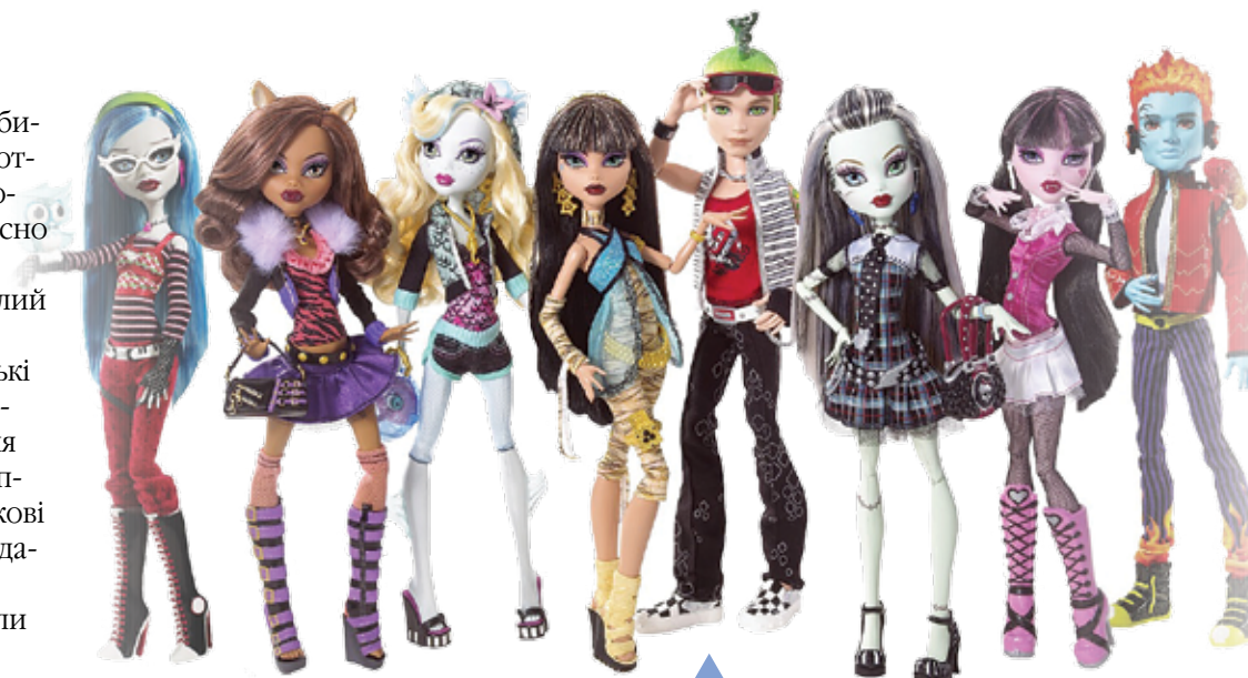
Чому може навчити ось така лялька маленьку дівчинку?!