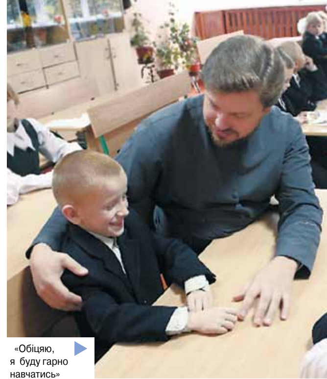
«Обіцяю, я буду гарно навчатись»