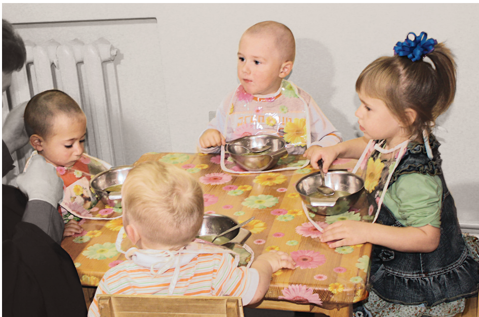
▲ Час обіду: малюки вже вміють їсти самостійно

УСТАНОВА ЦЯ – ОСОБЛИВА, ОСКІЛЬКИ ТУТ ПЕРЕБУВАЮТЬ ЖІНКИ, ЩО ВЖЕ НЕОДНОРАЗОВО БУЛИ ЗАСУДЖЕНІ ДО ПОЗБАВЛЕННЯ ВОЛІ. АЛЕ НАСПРАВДІ, ВОНИ ВІДКРИТІ ДО СПІЛКУВАННЯ. У КОЖНОЇ З НИХ, СВОЯ СУМНА ІСТОРІЯ, АЛЕ ДУШІ ЇХНІ ПРАГНУТЬ ДО ОЧИЩЕННЯ, ЛЛЮТЬСЯ СЛЬОЗИ КАЯТТЯ. І Я ВІРЮ, ЩО ЦІ СЛЬОЗИ ЩИРІ