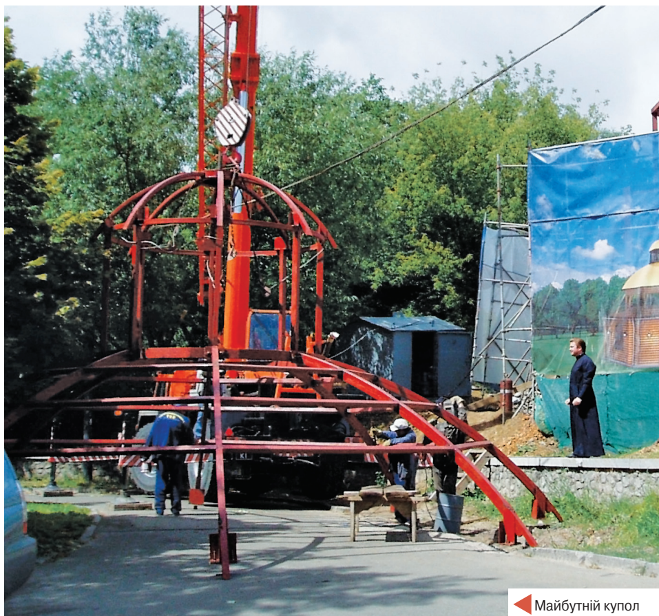
◀ Майбутній купол

Престольне свято з давніх давен вважалося одним з найголовніших свят парафії.