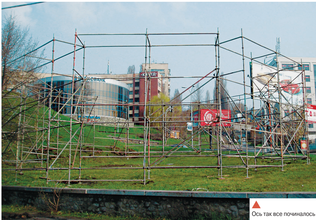
▲ Ось так все починалось