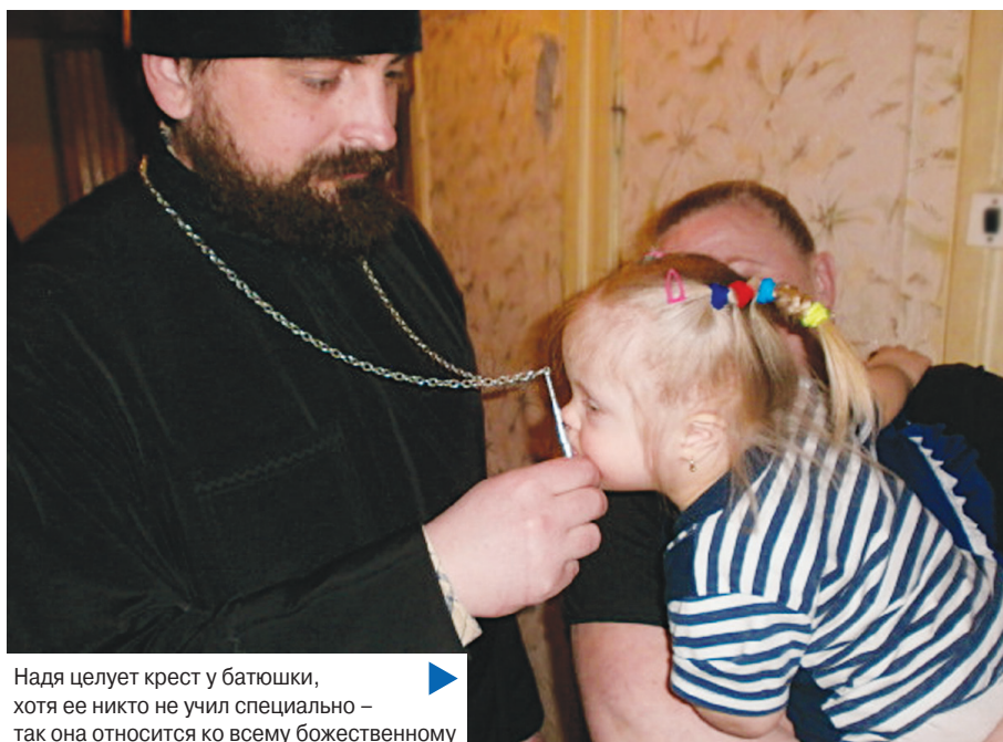
Надя целует крест у батюшки, хотя ее никто не учил специально – так она относится ко всему божественному