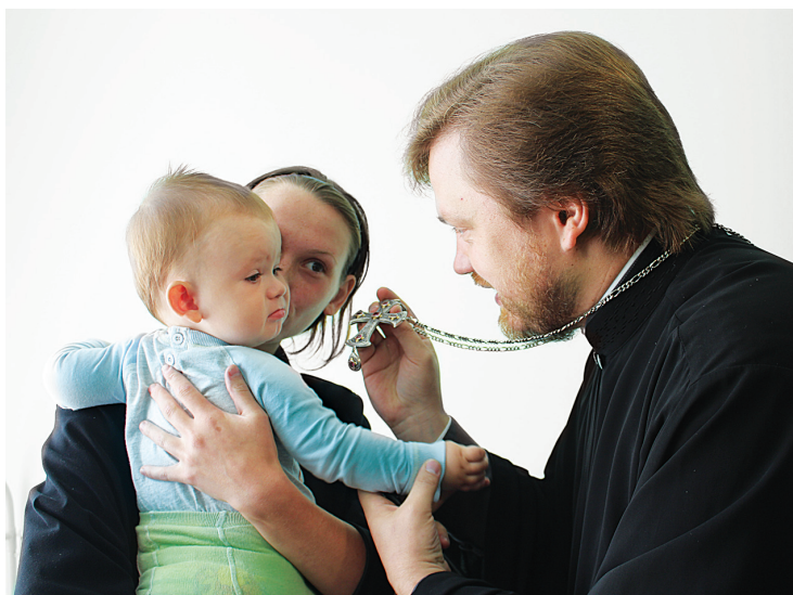
▼ Духовна бесіда із матерями. У кожній своя сумна історія