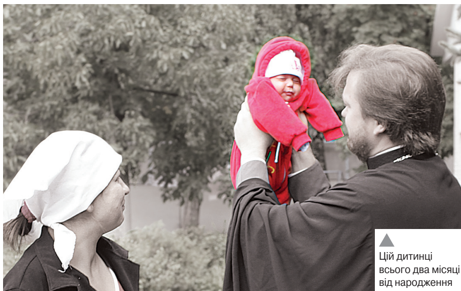
▲ Цій дитинці всього два місяці від народження

«Коли ми їхали до Чернігова, я хвилювався, чи зможу встановити контакт із цими жінками та дітьми, але побачивши їх очі, сповнені німого крику душі, я зрозумів: будь-що маю їм допомогти. Оскільки вони розкаюються у своїх вчинках та готові стати на шлях добра. Немає такого гріха, який би переміг Боже милосердя. А хто з нас без гріха», – поділився своїми враженнями протоіерей Олег Мельничук