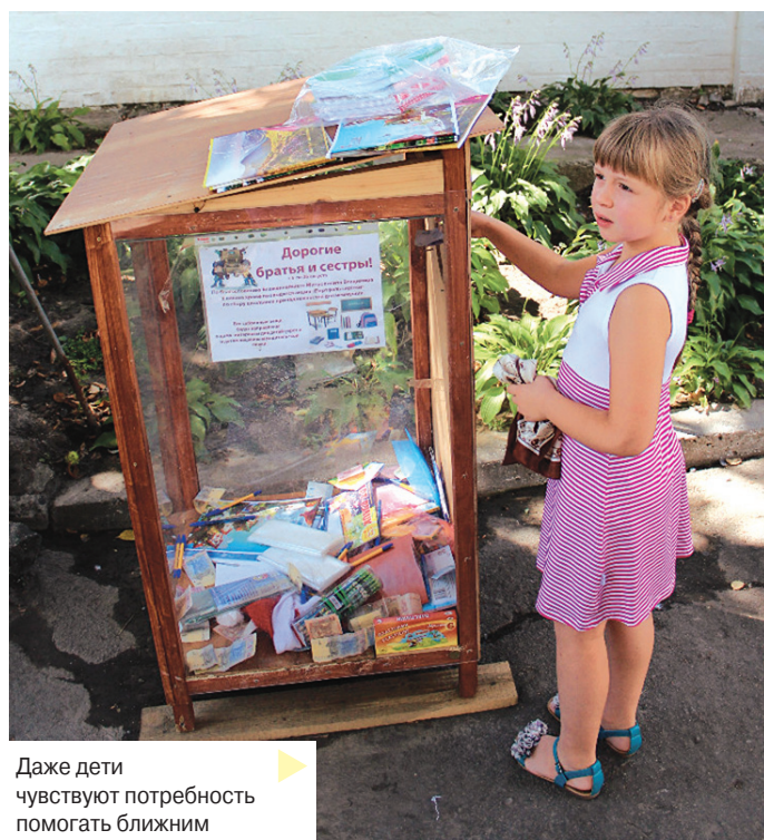
▲ Даже дети чувствуют потребность помогать ближним