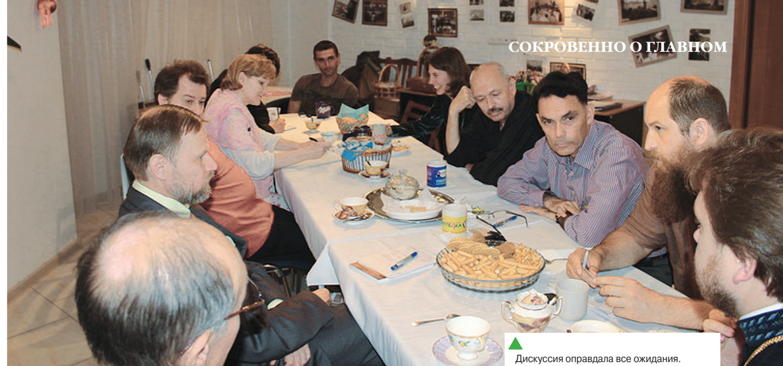
▲ Дискуссия оправдала все ожидания. И искренностью, и конструктивностью