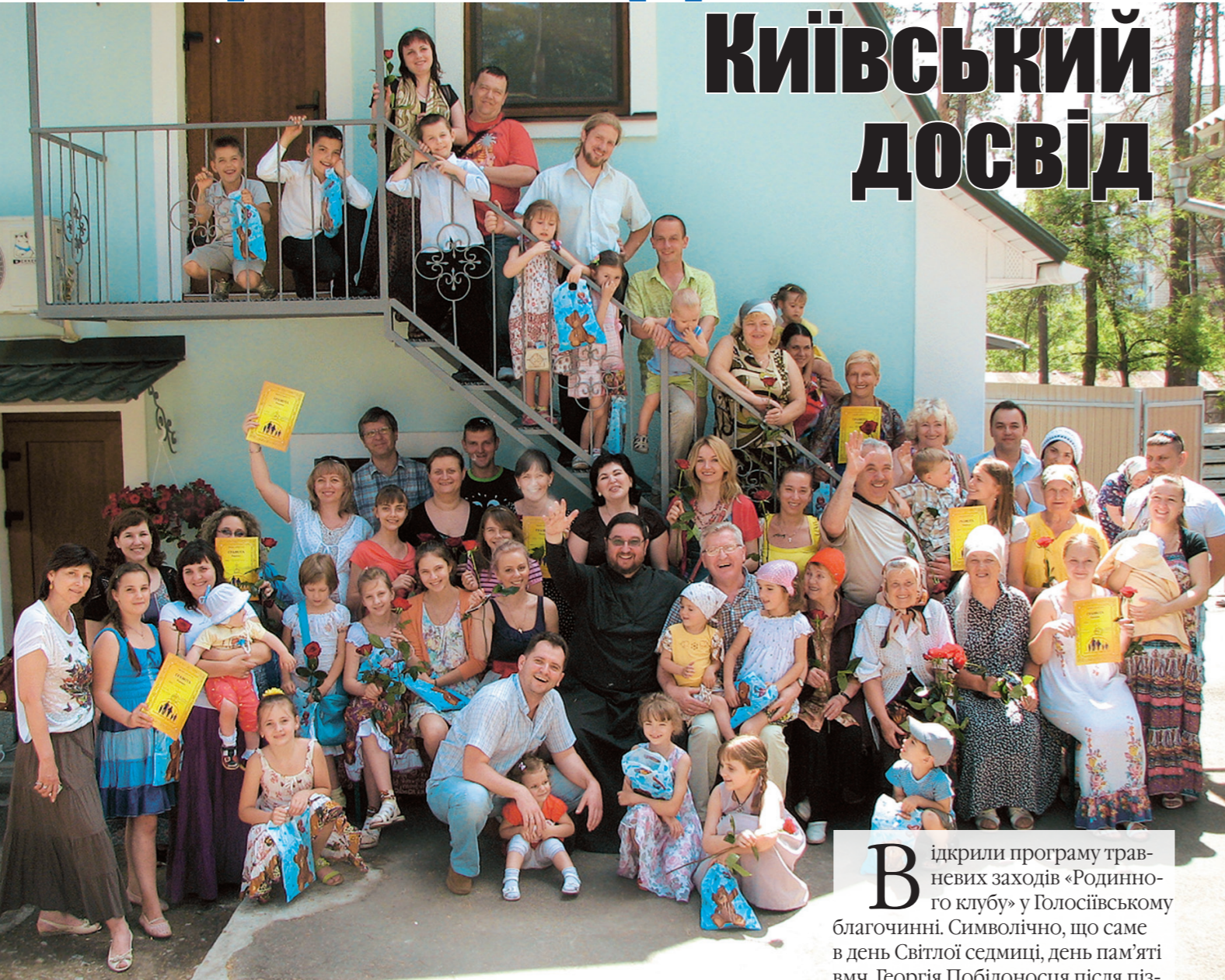
▲ Дні, проведені у «Родинному клубі», назавжди залишаться приємними спогадами

У рамках «Родинного клубу», організованого за ініціативи голови відділу у справах сім'ї Київської єпархії протоієрея Олега Мельничука, у благочиннях столиці минулого місяця відбувалися різноманітні заходи, присвячені сім'ї.