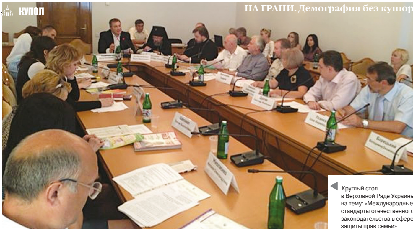
Круглый стол в Верховной Раде Украины на тему: «Международные стандарты отечественного законодательства в сфере защиты прав семьи»