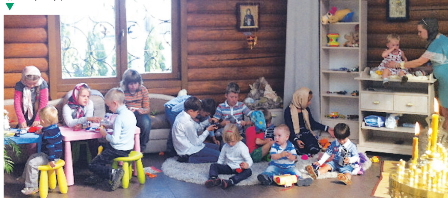
Дитячий куточок у храмі

сная школа», ветеранский клуб «Связь поколений», молодежное социальное служение. Особое место среди всех социальных инициатив занимает служение в роддоме. В 2002 году впервые в Украине создали храм в честь иконы Богородицы «Помощница в родах» в стенах роддома. Он стал местом духовно-психологической помощи беременным женщинам, роженицам и персоналу. ➔