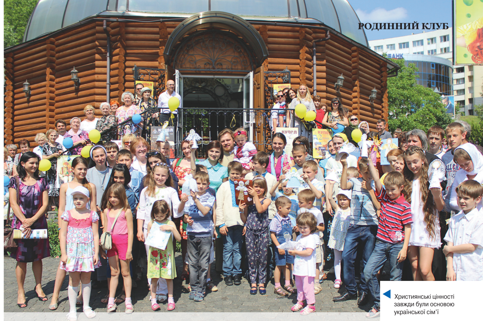
Християнські цінності завжди були основою української сім'ї

Прес-служба Київського єпархіального відділу у справах сім'ї