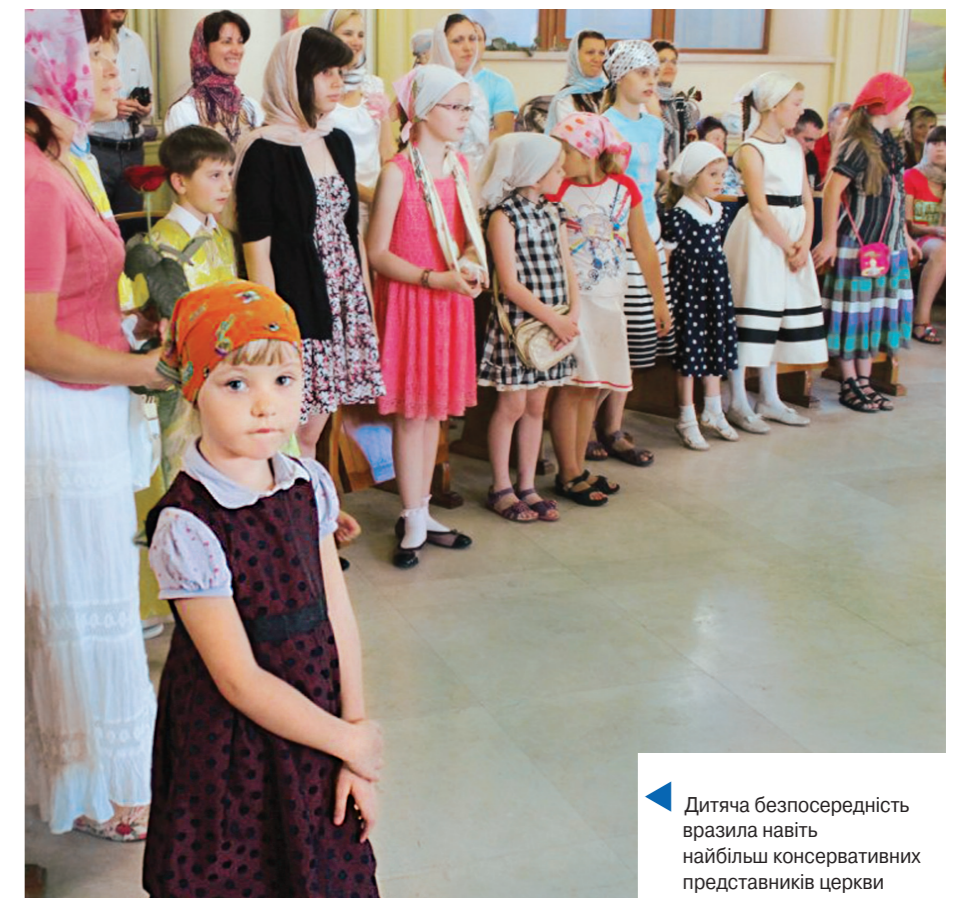
▲ Дитяча безпосередність вразила навіть найбільш консервативних представників церкви

Символічно дебютував «Родинний клуб» і в Деснянському благочинні. Зокрема при храмі