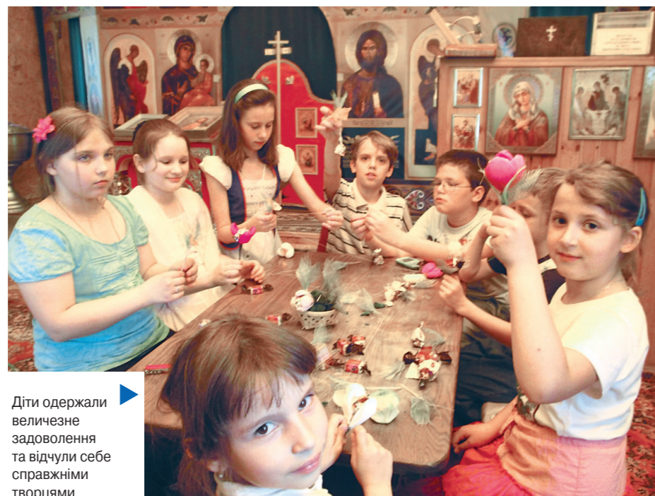
Діти одержали величезне задоволення та відчули себе справжніми творцями

«Сім'я, як один із найважливіших інститутів, віддзеркалює духовне та соціальне становище сучасного суспільства. Реалізація основних функцій сім'ї ускладнюється поширенням безвідповідального батьківства, розлучень, соціального