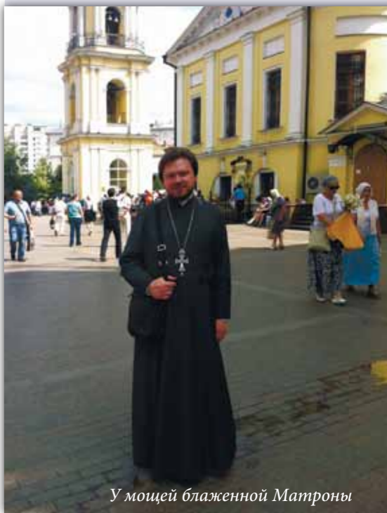
У мощей блаженной Матроны

«Старость — болезнь тела, здоровье души. Что ж? Неужели я предпочитал бы наоборот — здоровье тела и болезнь души? Да не будет у меня этого и в мыслях; как в теле, так и во всем человеке мне желанно и радостно благополучие прежде всего той части, которая ценнее». Ф. Петрарка