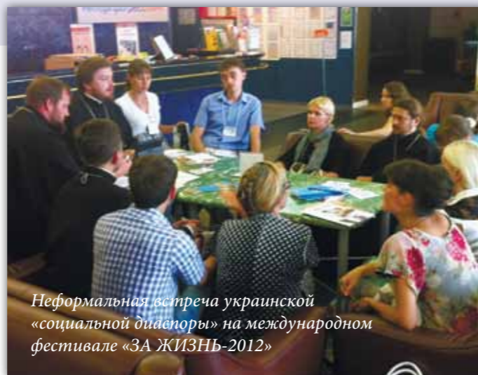
Неформальная встреча украинской «социальной диаспоры» на международном фестивале «ЗА ЖИЗНЬ-2012»

Молебен и проповедь! Признаюсь, я даже больше, чем молебна, ждал слова Патриарха. Ведь последование молебна я уже лет двадцать знаю, а что скажет сам Патриарх на мою родную «кровную» тему — в этом весь интерес!