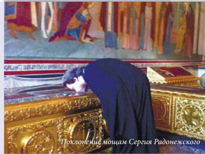
Поклонение мощам Сергия Радонежского